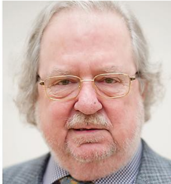
James P. Allison